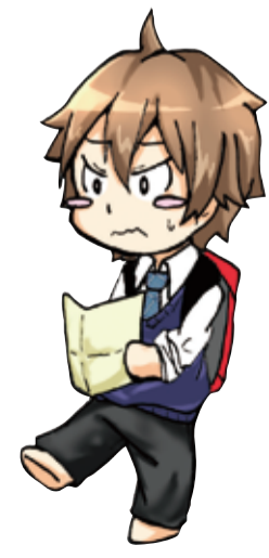
illustrated by 泉尾高校 漫画研究部 前部長

港区八幡屋1-6-4 ☎080-5310-6174 11:30~14:00/18:00~22:00 定休日:月曜終日・日曜夜 https://twitter.com/kohakusou228