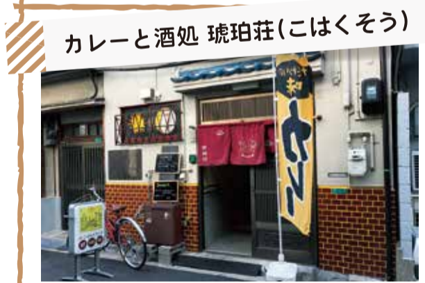
カレーと酒処 琥珀荘(こはくそう)