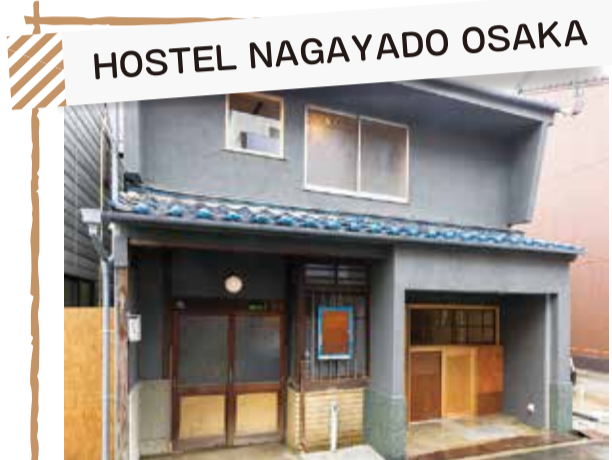
HOSTEL NAGAYADO OSAKA